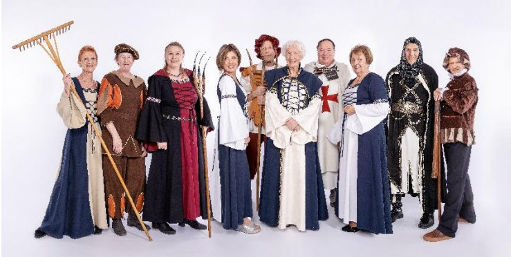
Das Galerie am Bach-Team